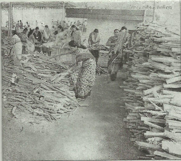
മൂന്നു പെരുമുടിയൂർ നെടുങ്ങനാട്ട് മുത്തശ്ശിയാർ കാവിൽ വിശ്വാസികൾ വാണിജ്യകരച്ചൊവ്വ ആഘോഷം