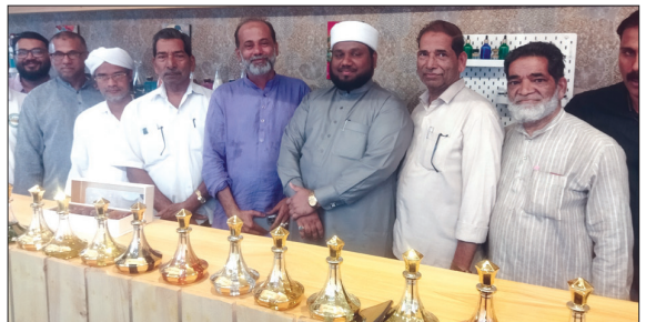
മണ്ണാർക്കാട് ഉദ്ഘാടനം നടത്തിയ കോൺഗ്രസ്, ബി.ജെ.പി അംഗങ്ങൾ.