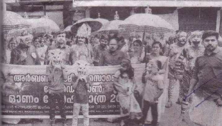
സോസൈറ്റിയുടെ ഓണാഘോഷത്തിൽ നിന്ന്